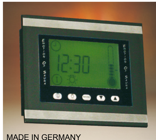
MADE IN GERMANY